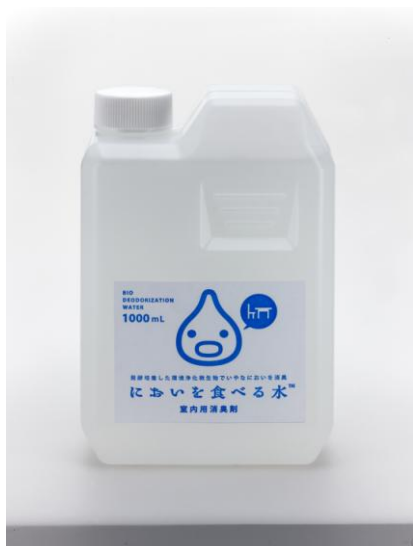
においを食べる水 室内用消臭剤 1,000ml