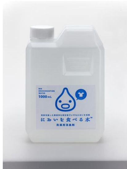
においを食べる水 洗濯用消臭剤 1,000ml