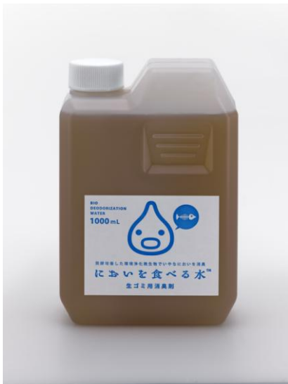
においを食べる水 生ゴミ用消臭剤 1,000ml